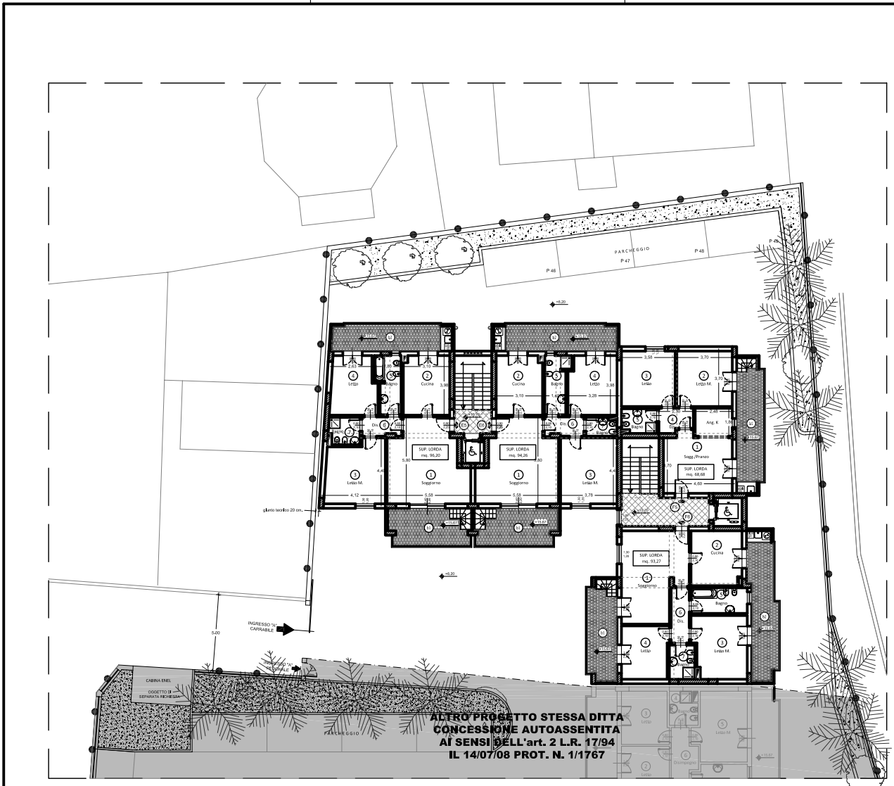
PLANIMETRIA a quota +15.70